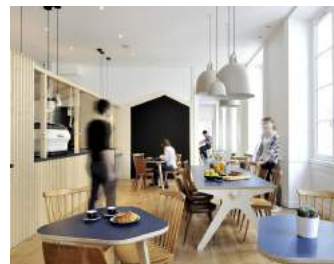
Away // Ilo ilo architecture

Au vu de cette réussite, La Fabrique souhaite désormais pouvoir essaier sa démarche d'accueil de personnes en insertion. Celle-ci a alors été nommée, et c'est ainsi qu'est né " Hop ! Emploi ". Des supports de communication et d'accompagnement ont été créés sur la base de l'expérience de La Fabrique, dans l'optique de pouvoir trouver des candidats à la duplication.