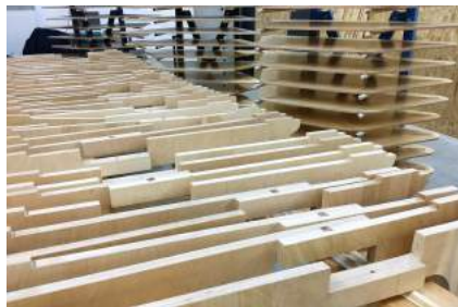
La Fabrique Multiple