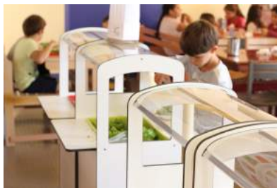
Meubles Igloo // Mobigone

La commande numérique permettant de réaliser le travail plus complexe de découpe du bois, il ne reste "plus que" le travail d'assemblage et de finition. Elle rend ainsi accessible à des personnes potentiellement non expertes la fabrication d'objets en bois. C'est de cette façon que La Fabrique peut accueillir des personnes exclues du marché du travail , accueil qu'elle réalise en collaboration avec des structures spécialistes de l'insertion.