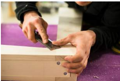
La Fabrique Projets

La Fabrique se décline aujourd'hui en deux autres activités, La Fabrique Multiple et La Fabrique d'en Face . Si la première a pour objectif de pouvoir accueillir de façon durable des personnes en insertion, la seconde a pour ambition d'ouvrir ses portes à tout public extérieur à La Fabrique.