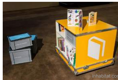
Ideas Box // Philippe Starck