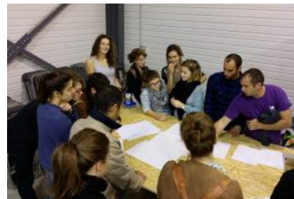
La Fabrique d'en Face