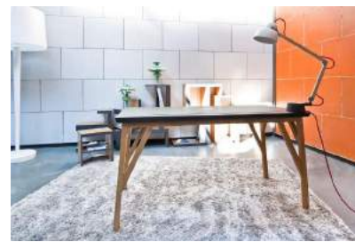
Mobilier et prototype

C'est sur la base de cette réussite que La Fabrique a pu envisager son développement autour de La Fabrique Multiple et de La Fabrique d'en Face, afin de mettre à profit ses compétences dans de nouveaux modes de fabrication et de collaboration .