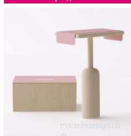
Table Napa // Bina Baitel